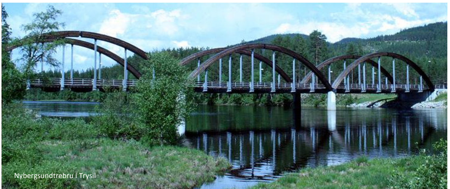
Nybergsundtrebru i Trysil

Torsdag 23. juli 2020 : Utflukt til Røros: Vi nyter også i