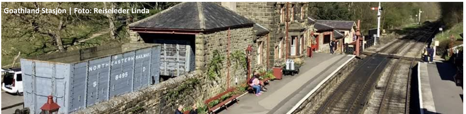
Goathland Stasjon | Foto: Reiseleder Linda

Utflukt til Scarborough: Dagens utflukt tar oss med til byen Scarborough, lokalisert på nordsjøkysten. Fra gammelt av var dette en kjent handleby, men har i moderne tid blitt et populært reisemål for britene på sommeren, grunnet sine lange flotte strender. Her får vi tid på egenhånd til å vandre rundt og besøke mange av de lokale stedene, f.eks. gamlebyen Peasholm Park. De som ønsker kan bli med reiselederen på et besøk til Scarboroughslottet. Inngangen er ikke inkludert, men kan bestilles ved påmelding til turen. Samlet reiser vi tilbake til York på ettermiddagen.