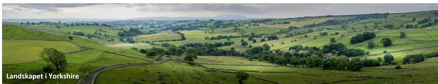
Landskapet i Yorkshire