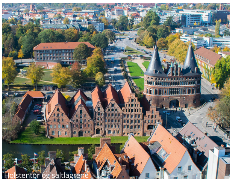
Holstentor og saltlagrene

Takk for turen - takk for at du ble med!