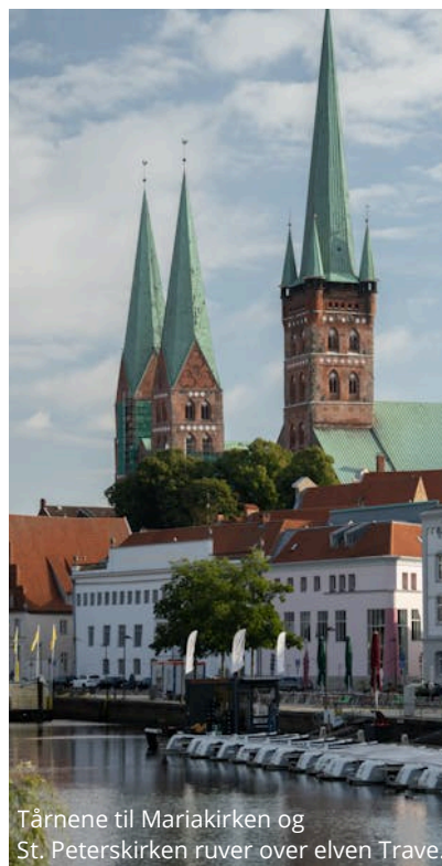
Tårnene til Mariakirken og St. Peterskirken ruver over elven Trave.