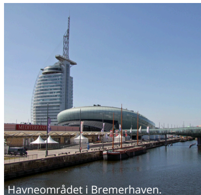
Havneområdet i Bremerhaven.

Gamlebyen i Lübeck har mange, koselige restauranter og trivelige bakgårder, så denne dagen lar vi hver enkelt selv bestemme hvor de vil spise middag.