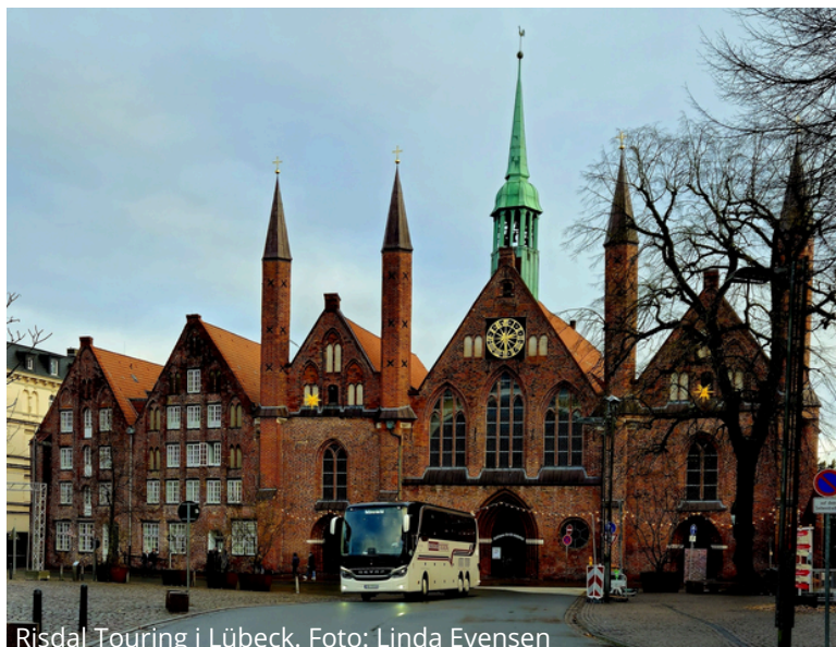
Risdal Touring i Lübeck.