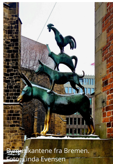
Bymusikantene fra Bremen.