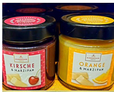
Marsipansyltetøy.