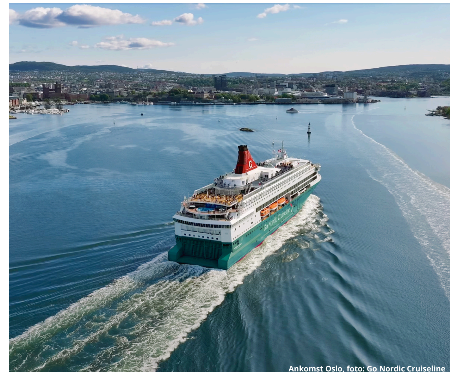
Ankomst Oslo, foto: Go Nordic Cruiseline