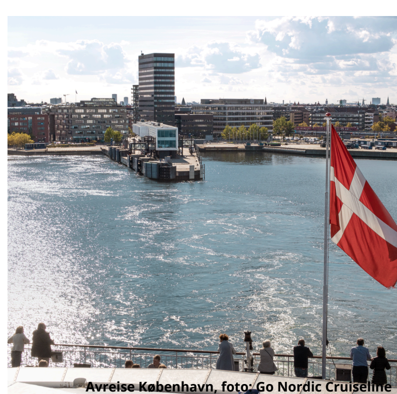
Avreise København