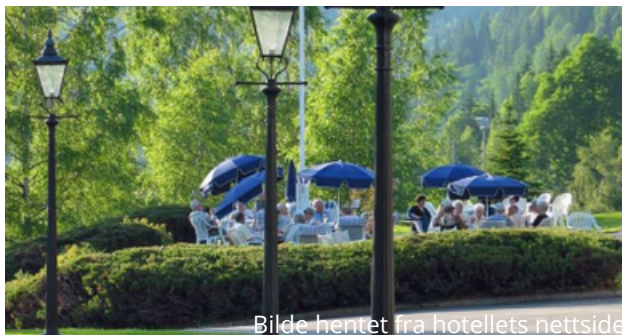
Bilde hentet fra hotellets nettside

Tilbake på hotellet om kvelden, nyter vi en deilig middag og hverandres selskap. Vi hygger oss på tur!