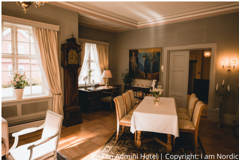
Rjukan Admini Hotel